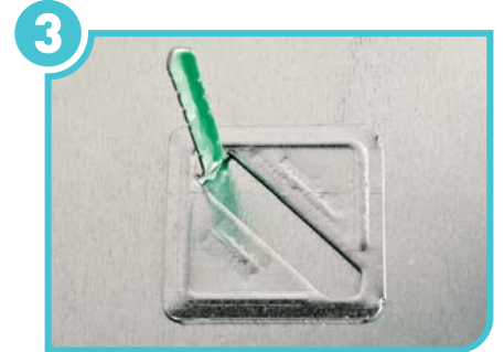
3 Adhere to a clean and oil-free application surface.