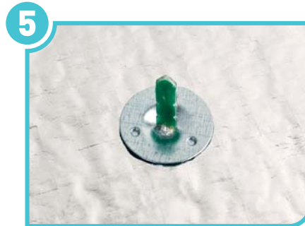
5 Insert the round plate to the tongue of the PRATİK PİM. Lock it by turning to the left of right.