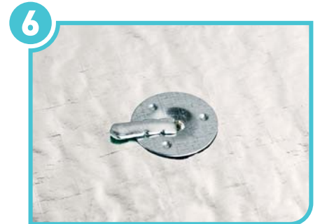
6 Fold the tongue onto the plate and complete the fixing.