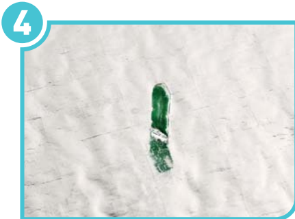
4 Stick the isolation material into the PRATİK PİM with the folio side on top.