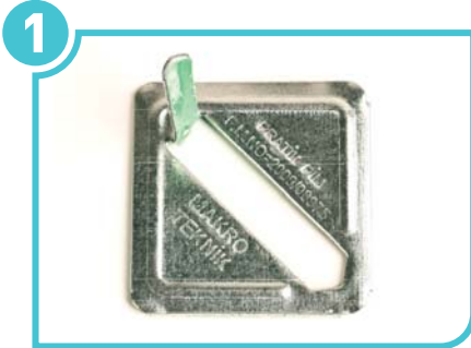
1 Lift the tongue in PRATİK PİM.