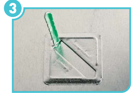
Temiz ve yağdan arındırılmış uygulama yüzeyine yapıştırılır.