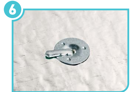
Dilin dışarda kalan kısmı plaka üzerine katlanarak tespitleme sağlanır.